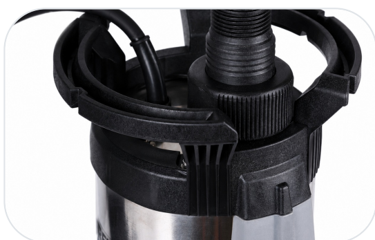
Horní madlo s výtlačným hrdlem a přívodním kabelem.