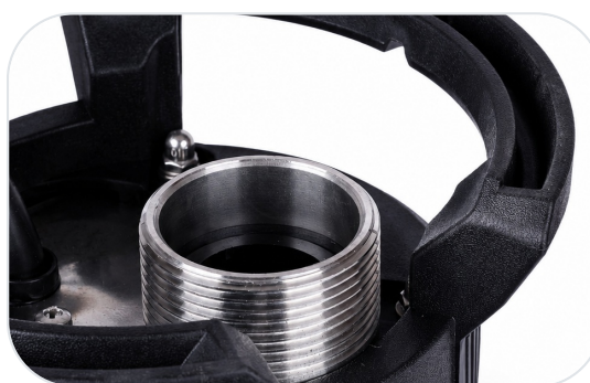
Detail kovového závitu a robustních konstrukčních částí.