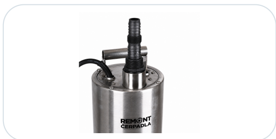
Horní výtlačné hrdlo s univerzálním adaptérem a nerezovým madlem.