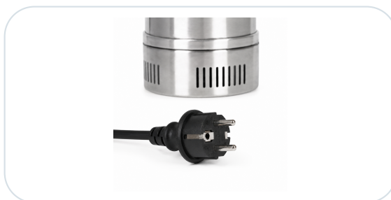
Detail nerezového těla a spodních sacích otvorů čerpadla.